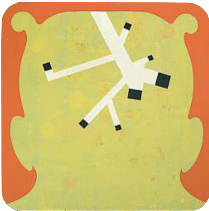
Abstrakt tanke , 2004 . 92 , 92cm, akryl på epoxilaminat .