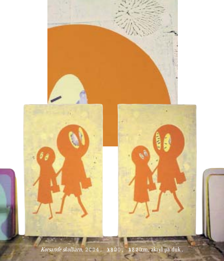
Korsande skolbarn, 2004. 1800, 1800cm, akryl på duk.