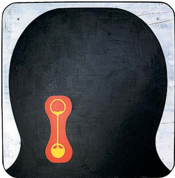
Tidlös , 2004. 1000, 1000cm, akryl på aluminium.