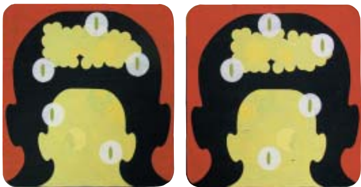
Desillusion , 2004. x500, x500cm, akryl på aluminium.