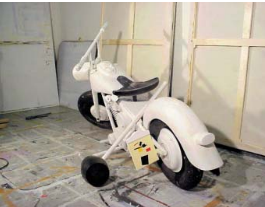
Klubben, 2003 Skala 1 : 1 målad trä.