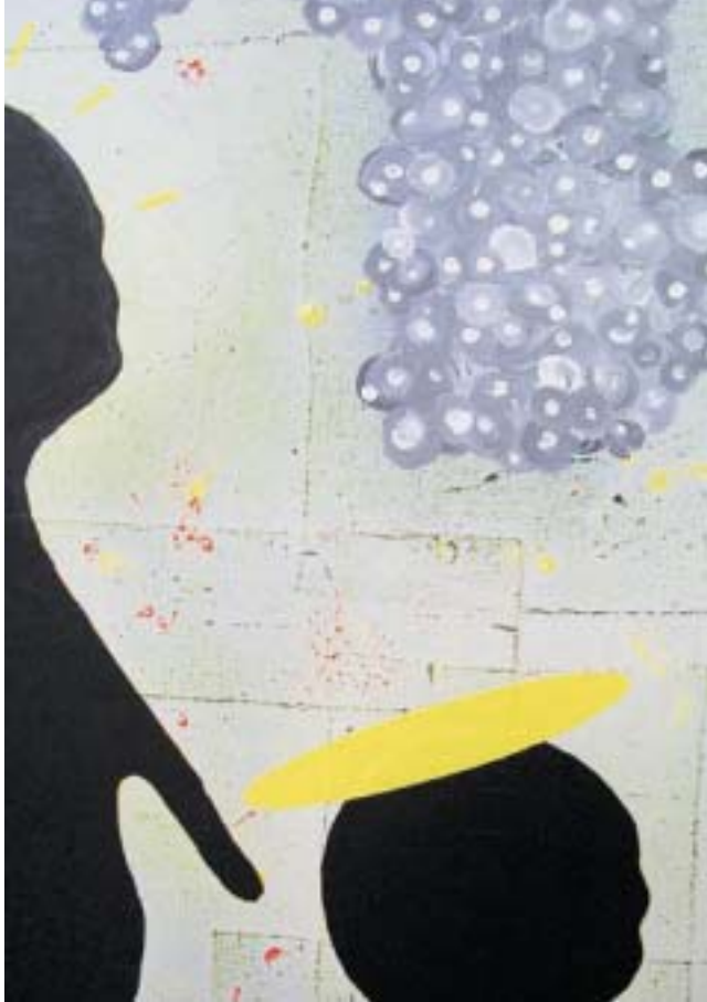
Marsianer , 2004. 1800, 1800cm, akryl på duk.