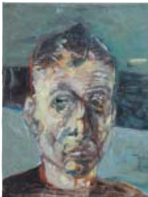
Olja på duk, 2004. 40x30 cm