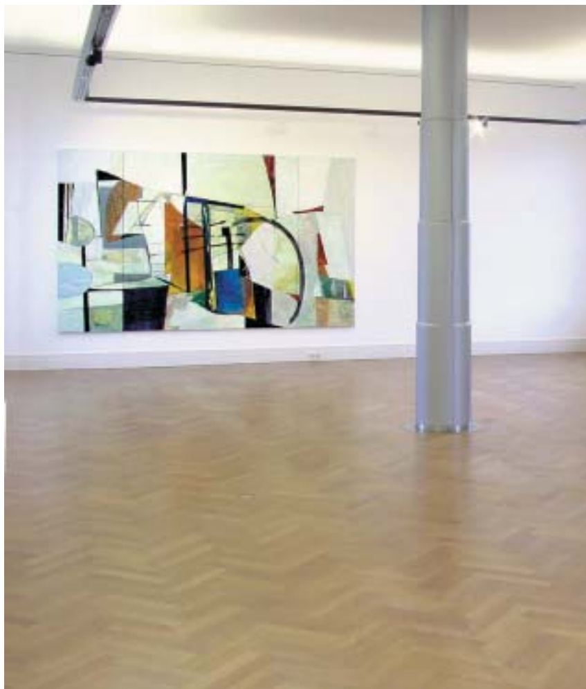
Gorcums Museum 2004