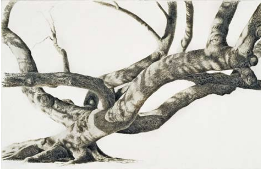
Red Silk Cottonwood III. Acrylic on canvas, 185x122 cm.