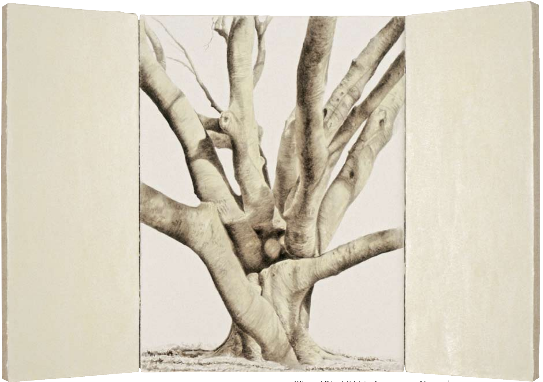
Yellowwood, Triptych (light) . Acrylic on canvas, 54x86 cm total.