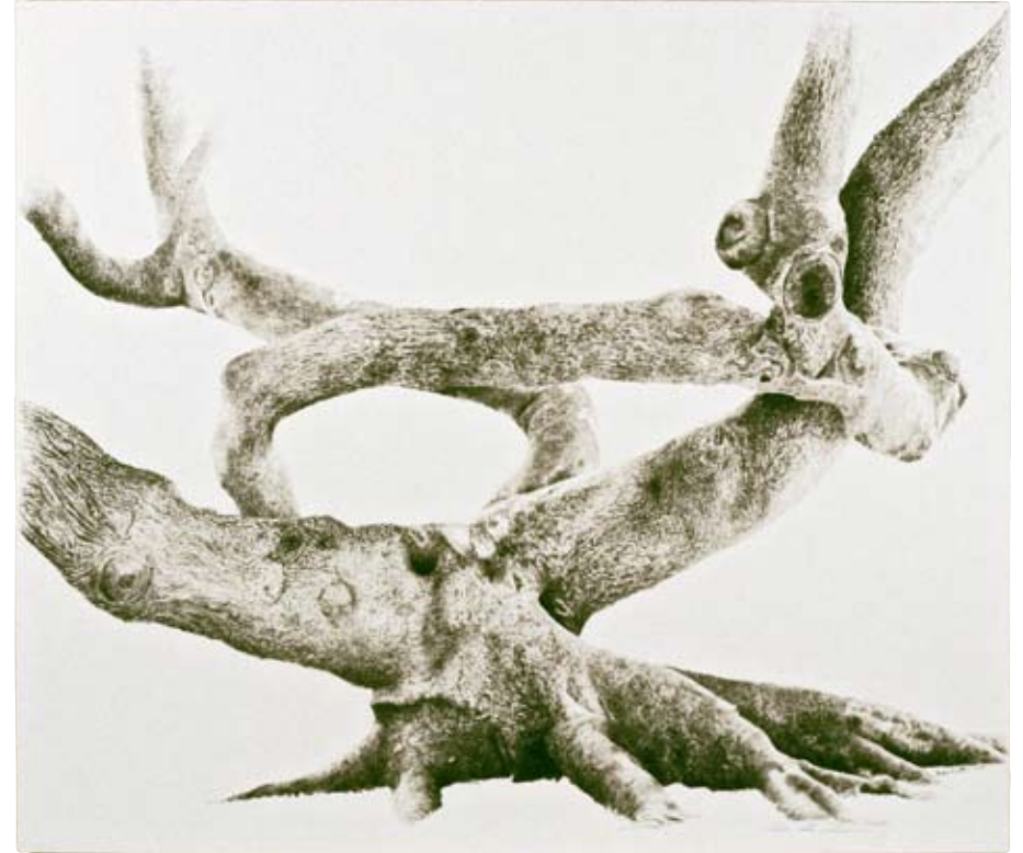
Red Silk Cottonwood II. Acrylic on canvas, 216x185 cm.