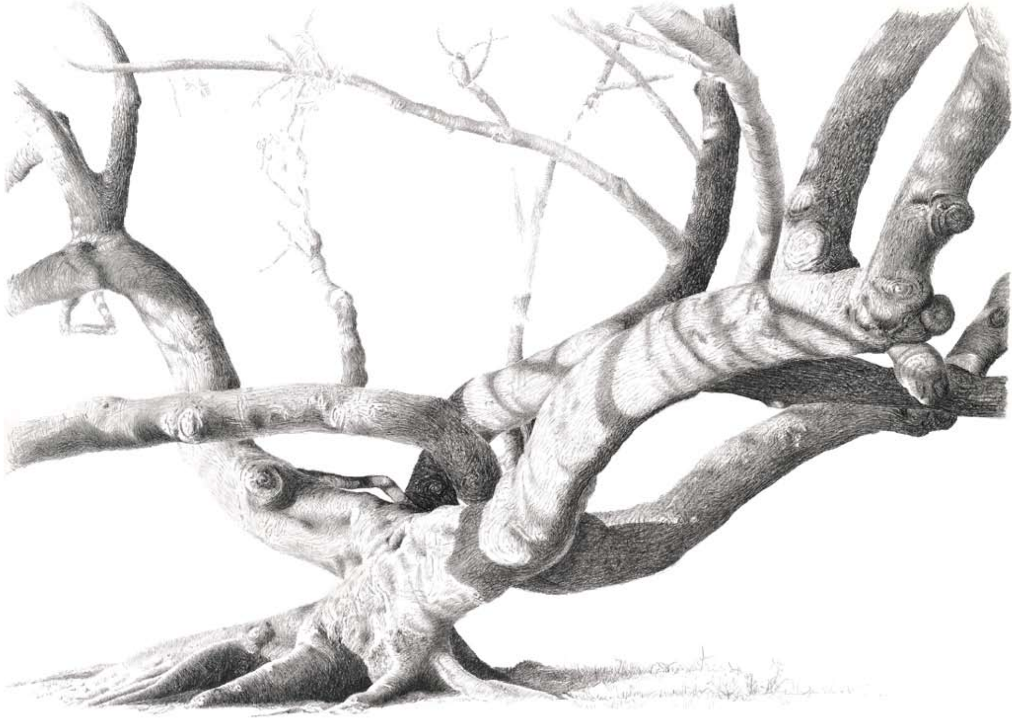
Red Silk Cottonwood. Digital print on paper, 50x70 cm.