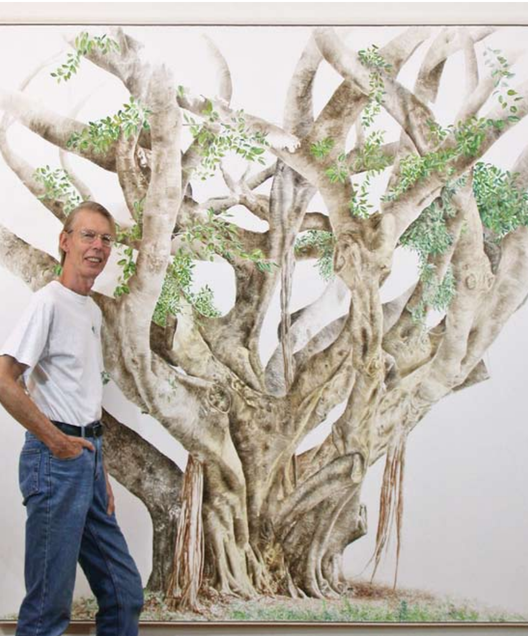
Anders Knutsson. Council Fig . Acrylic on canvas, 230x195 cm.

Anders Knutsson Born 1937 in Malmö, Sweden. www.andersknutsson.com