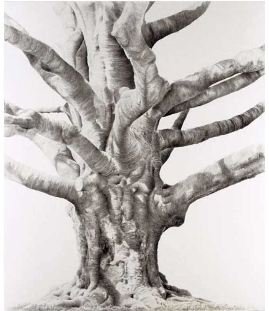
Great Copper Beech. Acrylic on canvas, 216x185 cm.