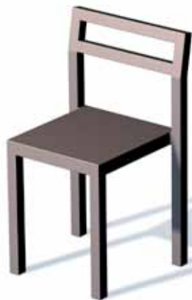
NON av Komplot Design, 2000.

Född 1947 i Köpenhamn. Bosatt i Köpenhamn. Utbildad vid Kungliga Konsthögskolan, Arkitekt-högskolan, Köpenhamn 1973. Båda har samarbetat med Källemo sedan 1998.