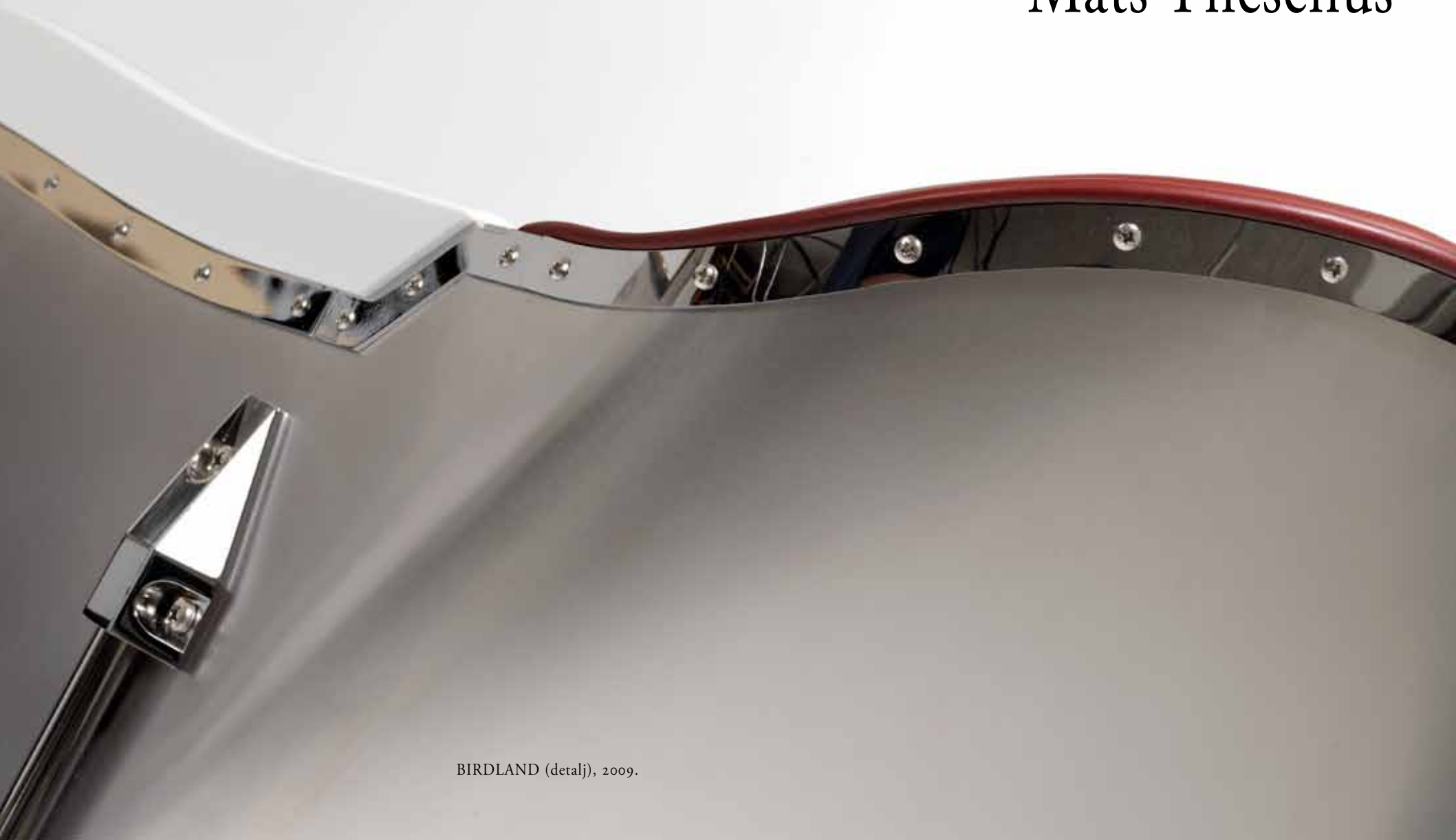
BIRDLAND (detalj), 2009.