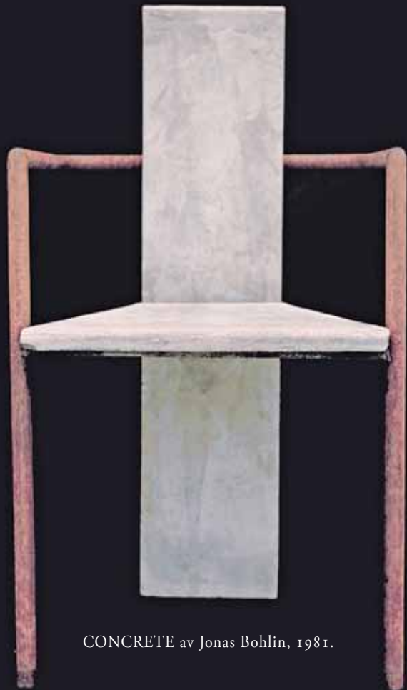
CONCRETE av Jonas Bohlin, 1981.