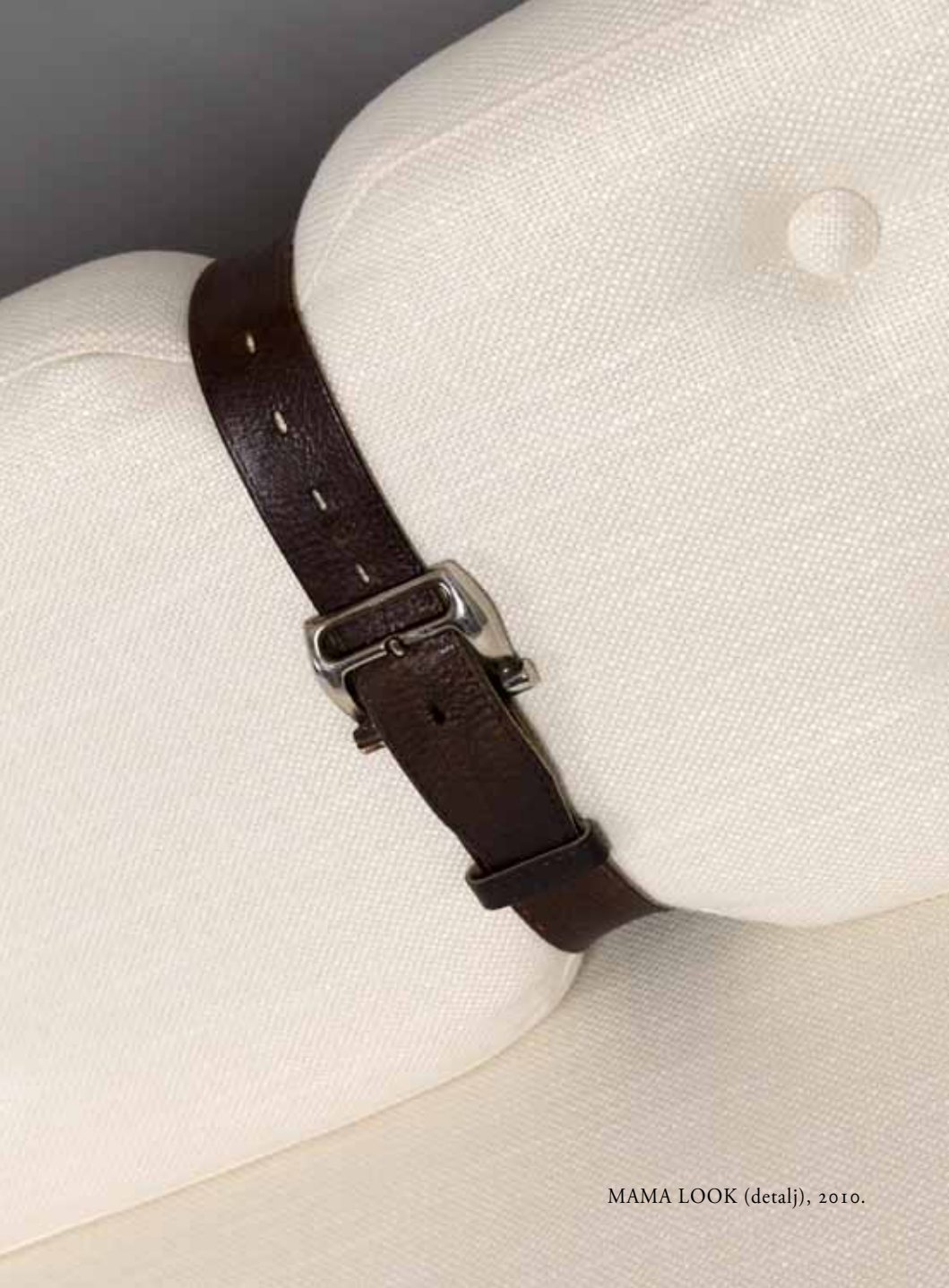
MAMA LOOK (detalj), 2010.