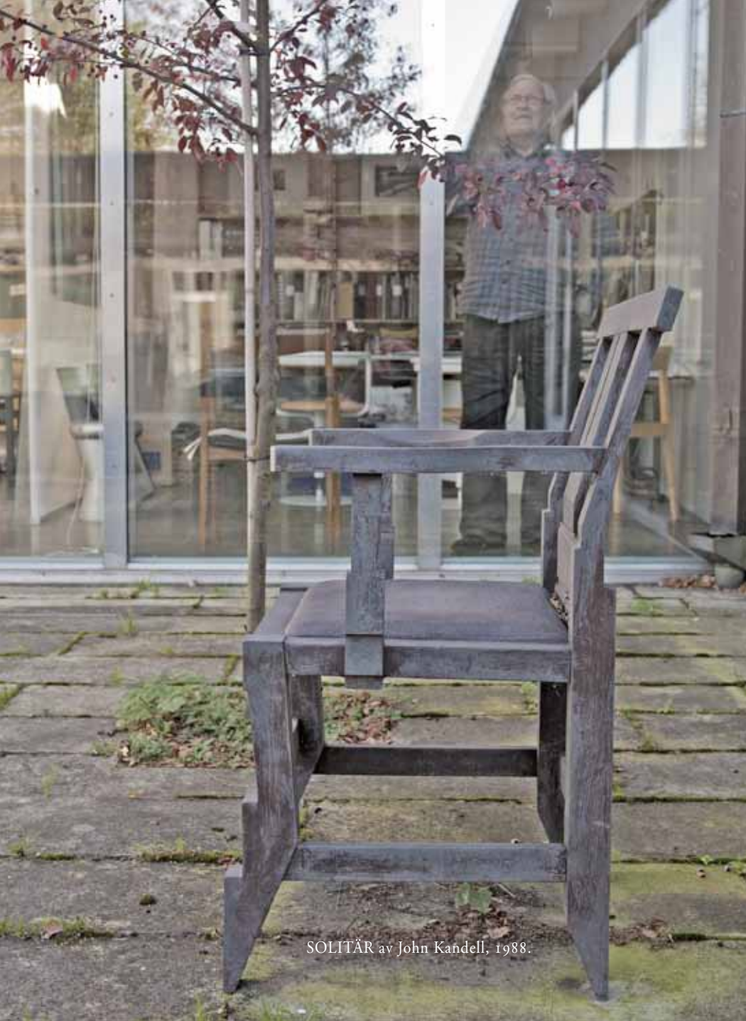
SOLITÄR av John Kandell, 1988.