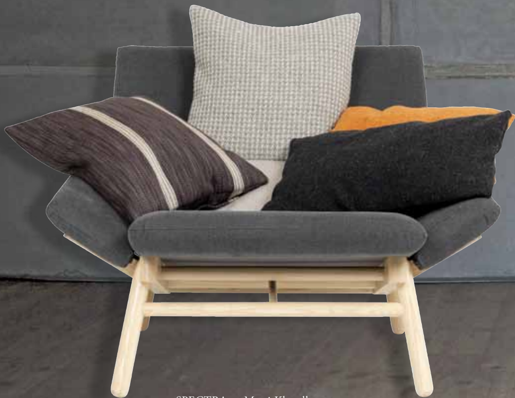
SPECTRA av Matti Klenell, 2011.