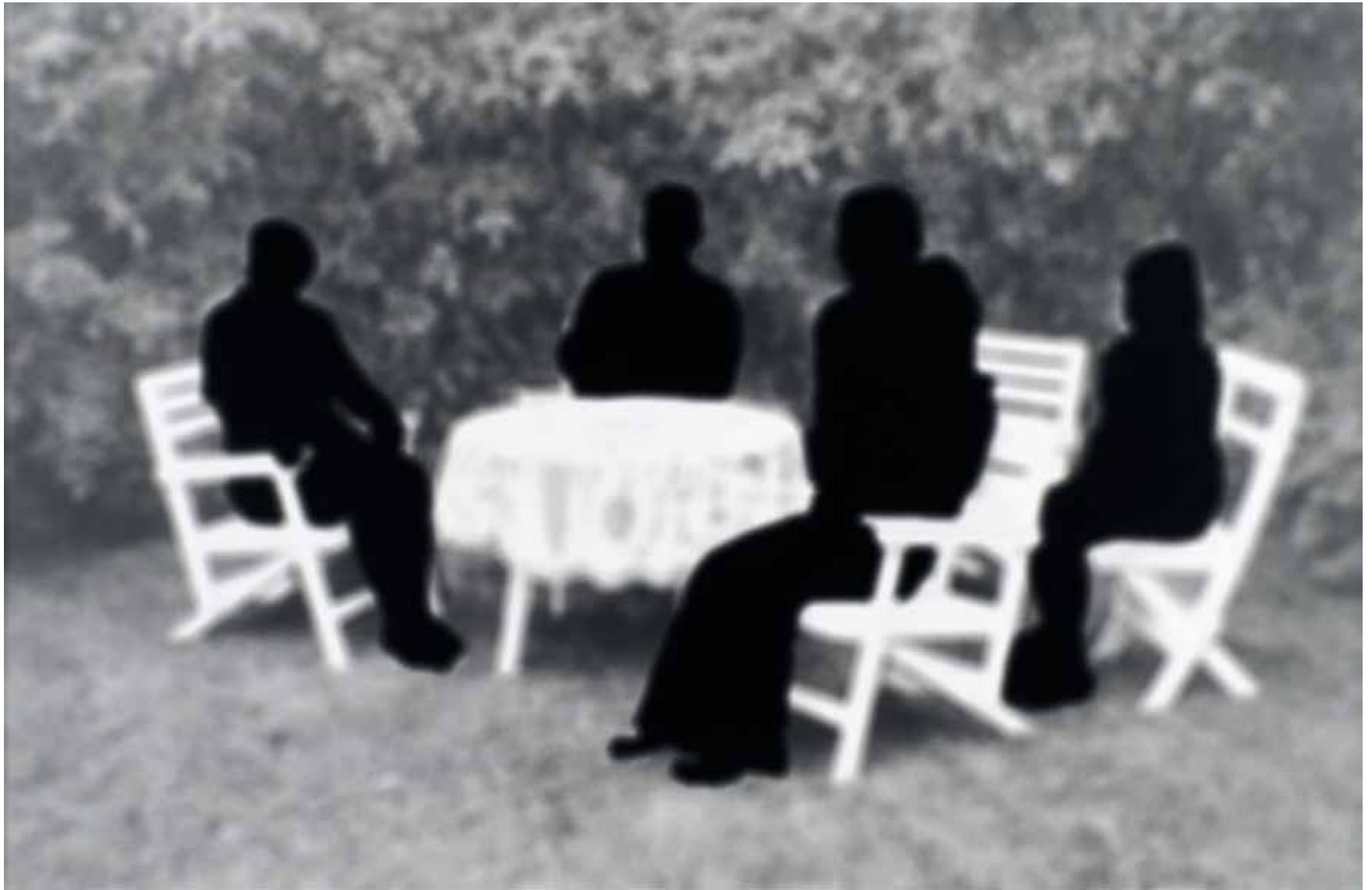
Utan titel/Ohne Titel (Söndag/Sonntag). Silvergelatinfotografi. 1992-2000.