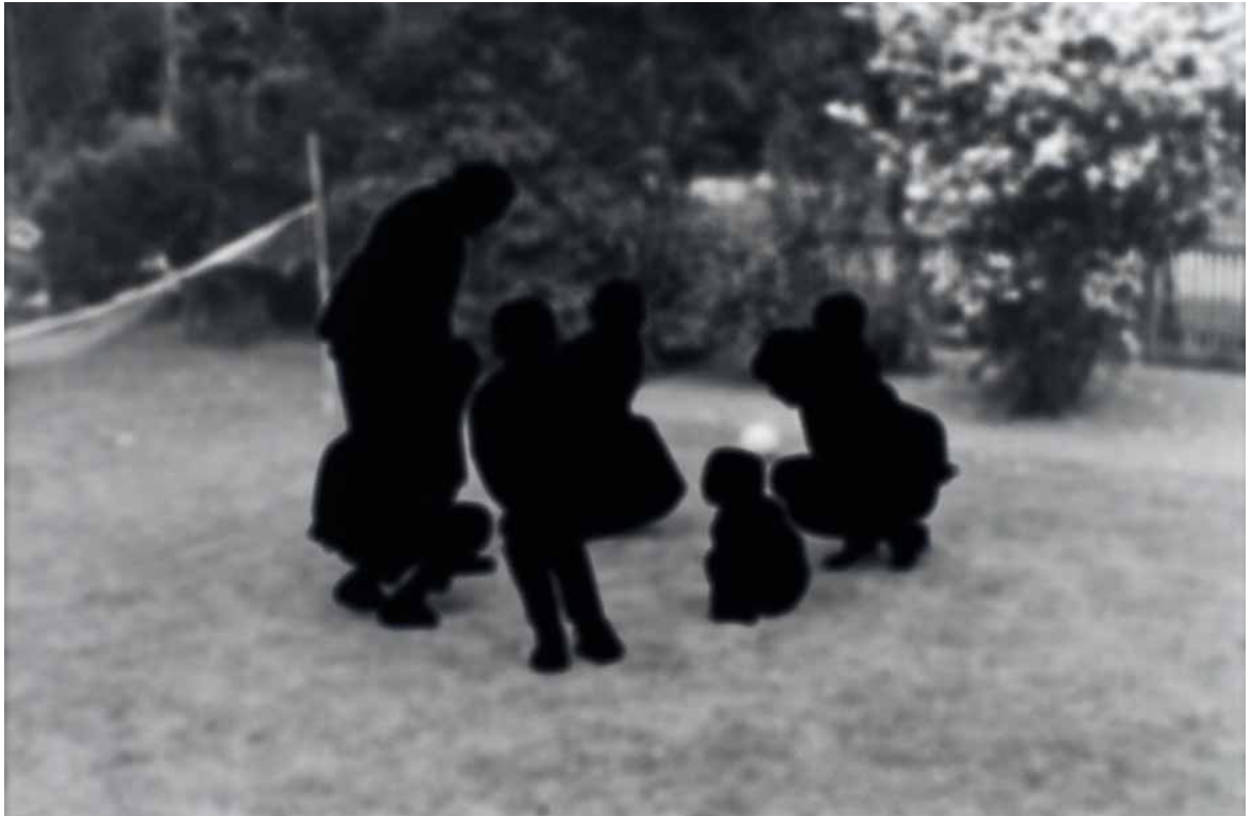
Utan titel/Ohne Titel (I ring/Im Kreise). Silbergelatin fotografi. 1992-2000.