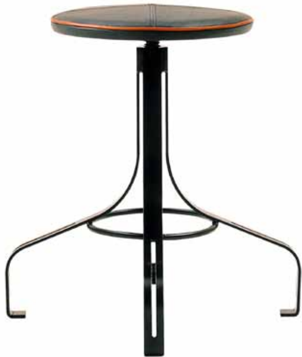
PIANO – 1989