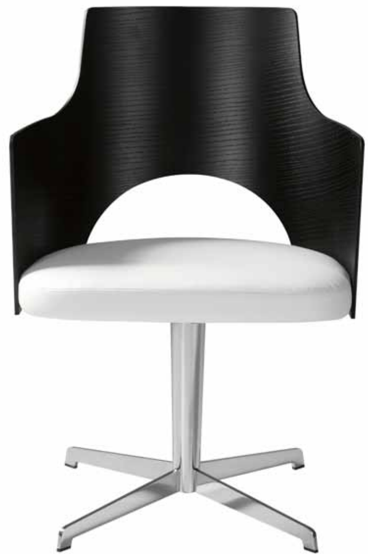
CORTINA – 2005