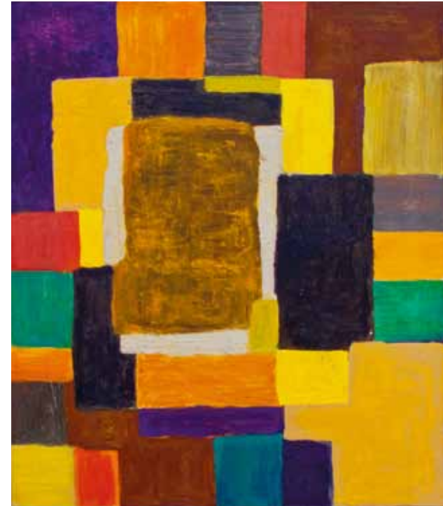
"Utän titel" - 5847 Olja på pannå, 73 x 63 cm, 2014.