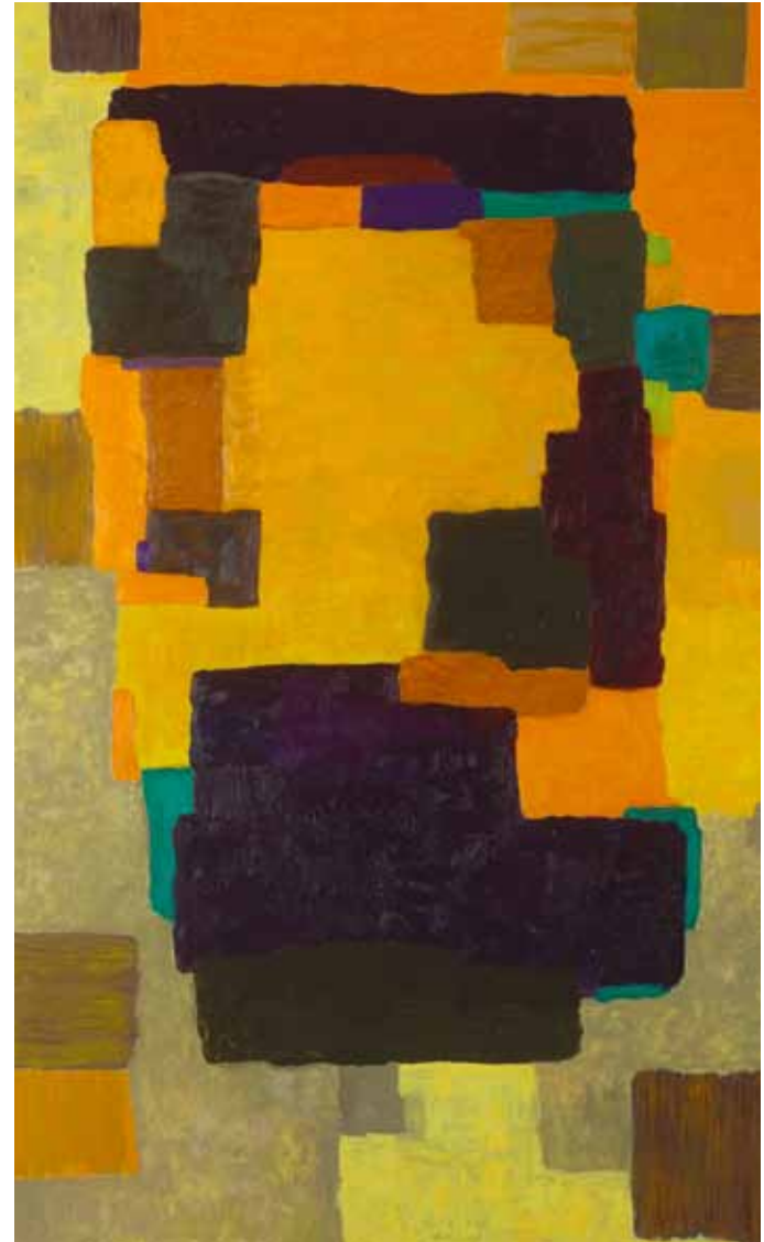
"Utan titel" - 0026 Olja på pannå, 187 x 123 cm, 2013.