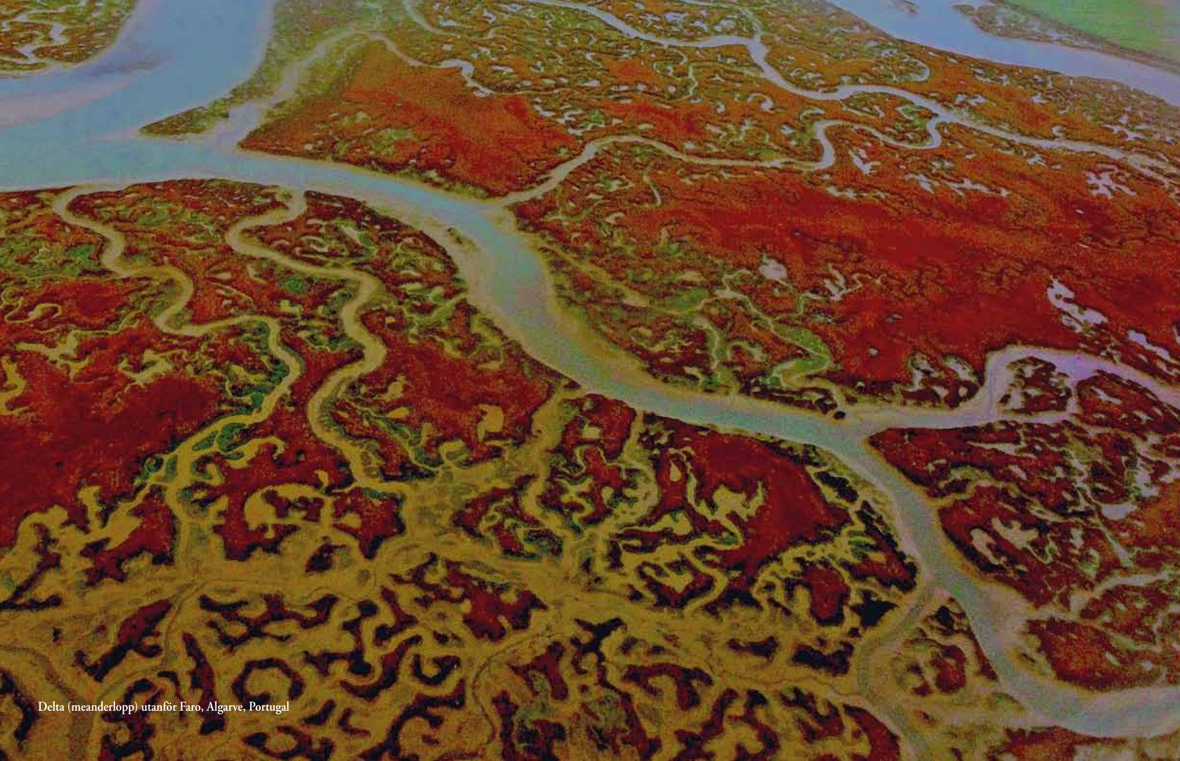
Delta (meanderlopp) utanför Faro, Algarve, Portugal