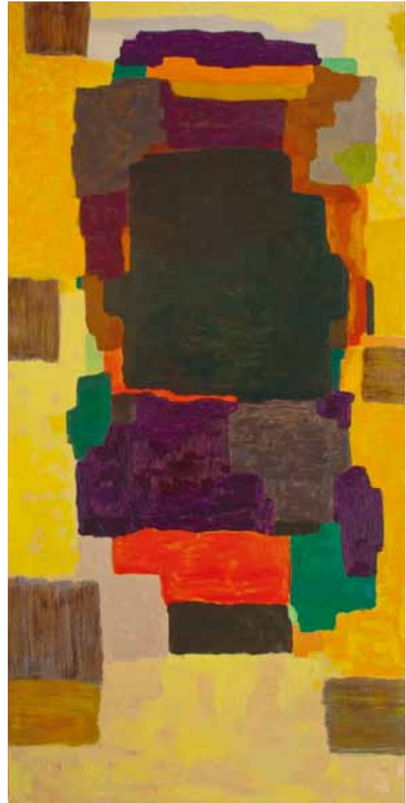
”Utan titel” - 0028 Olja på pannå, 187 x 93 cm, 2013.