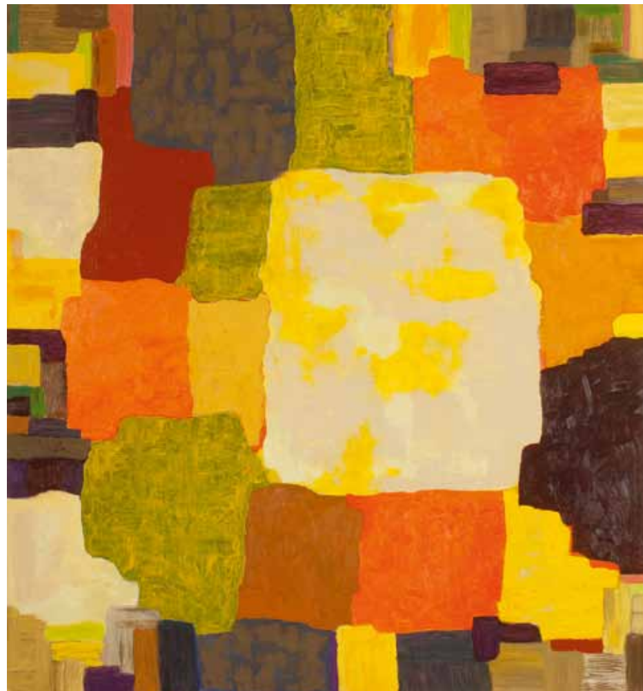
”Utan titel” - 0021 Olja på pannå, 170 x 160 cm, 2012.