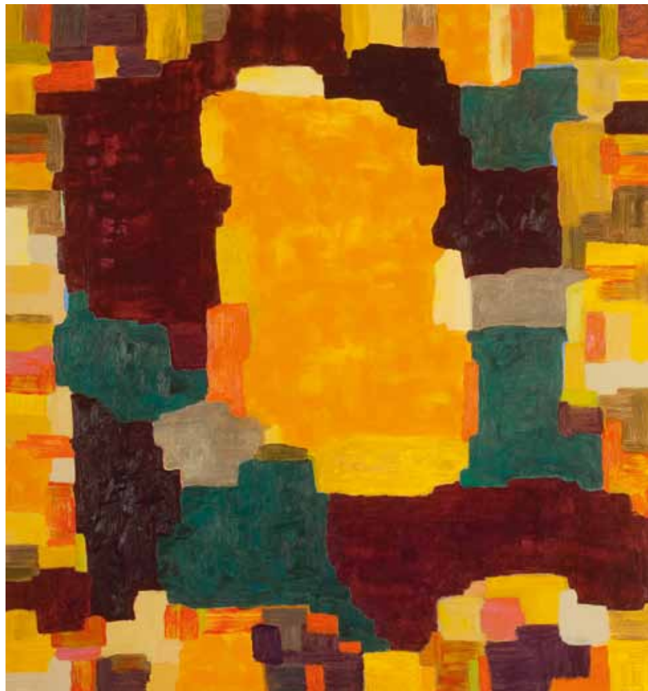
”Utan titel” - 0023 Olja på pannå, 170 x 160 cm, 2012.