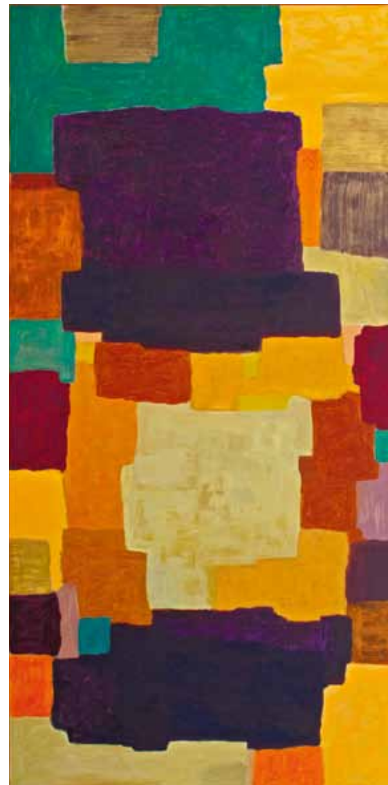
"Utän titel" - 5887 Olja på pannå, 187 x 93 cm, 2013.