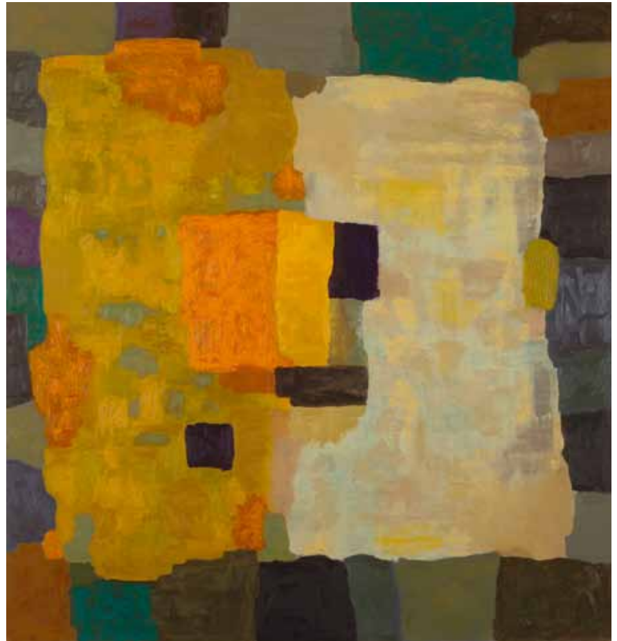
”Utan titel” - 0006 Olja på pannå, 150 x 140 cm, 2012.