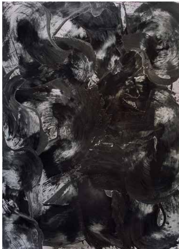
Lukas Göthman CHARGED. Olja på duk, 163x118 cm, 2015.