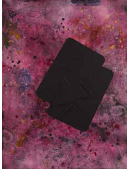
Joachim Carlsson TOKEN. Akvarell och akryl, UV-lack duk, 66x49 cm, 2016.