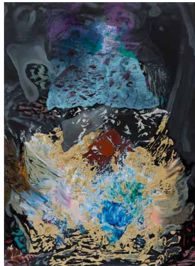
Roger Metto MICKEYS TUGBOAT. Olja på mdf, 30x22 cm, 2016.