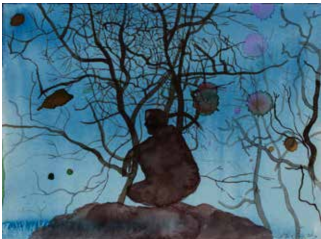
Roger Metto SASTRUGI. Akvarell, 23x31 cm, 2016.