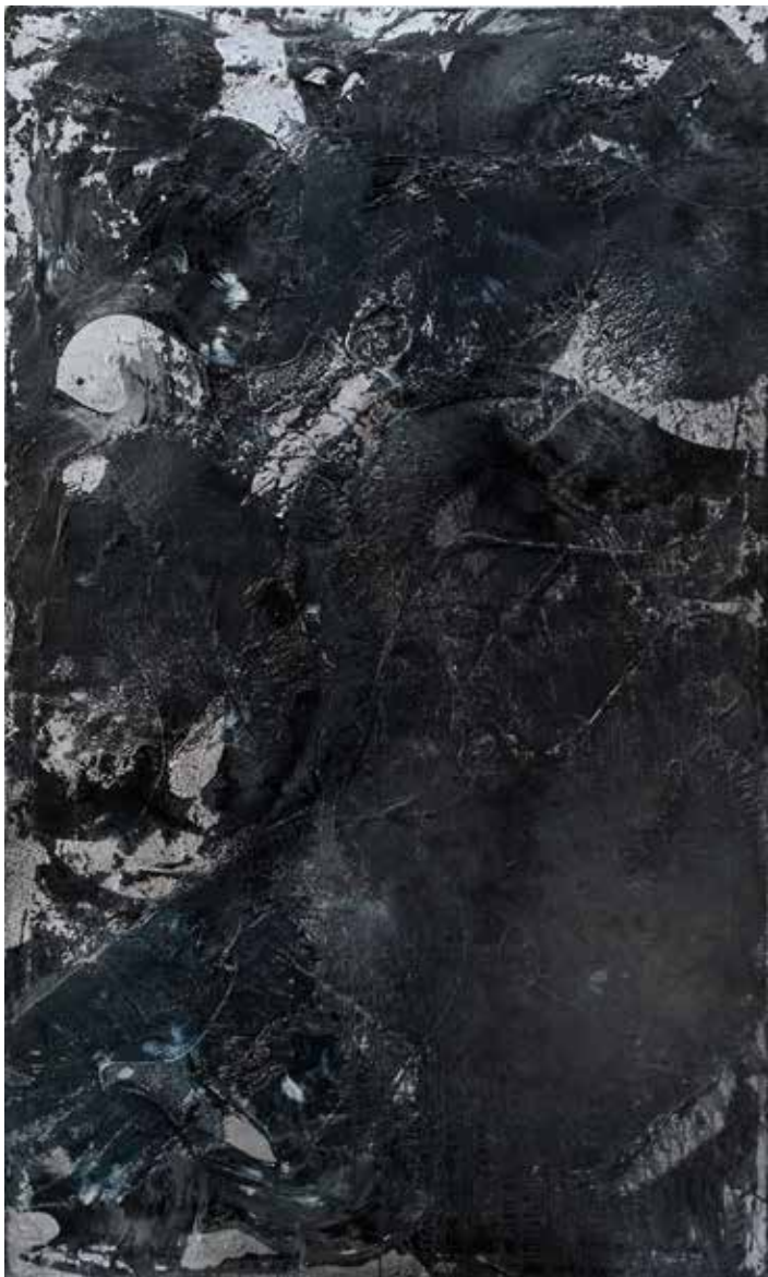
Lukas Göthman WELCOME TO THE OCEAN. Olja på duk, 200x120 cm, 2015.