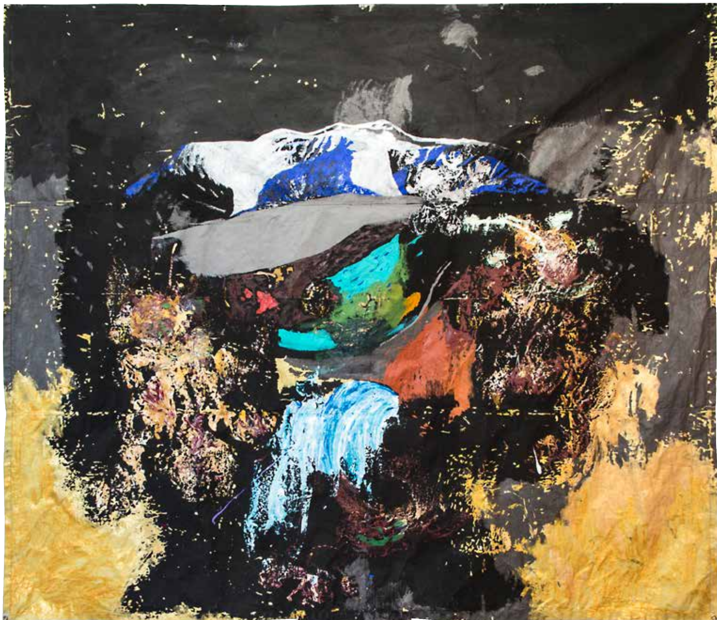
Roger Metto. INTERGALACTIC GLOW. Akryl på akrylväv, 360x310 cm, 2016.