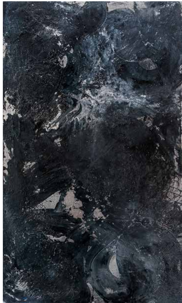
Lukas Göthman LOVERS AND DREAMERS UNITE. Olja på duk, 200x120 cm, 2015.