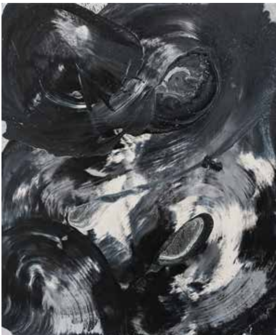
Lukas Göthman LOVERS AND REBELS. Olja på duk, 91x75 cm, 2015.