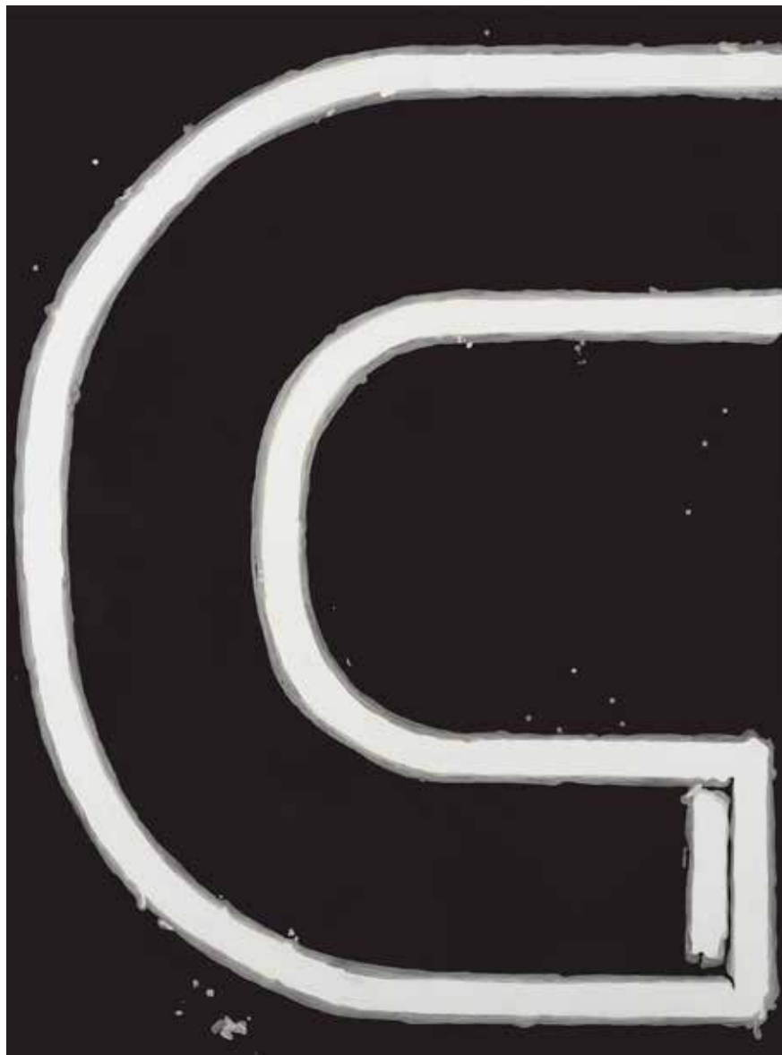
Joachim Carlsson PLATS, BYTA PLATS. Akvarell och akryl, UV-lack duk, 198x147 cm, 2015.