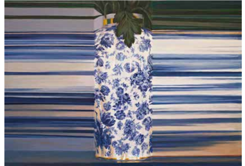
En blå still-målning. 2016, olja på duk, 50x70 cm