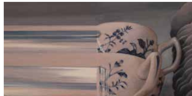
Stilla Liv II. 2016, olja på duk, 20x40 cm