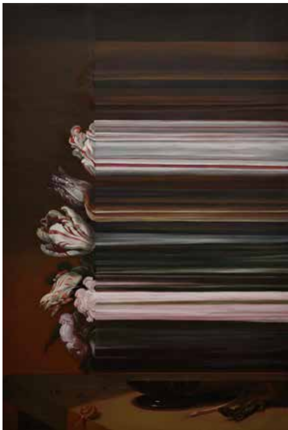
Still-målning I. 2016, olja på duk, 120x80 cm