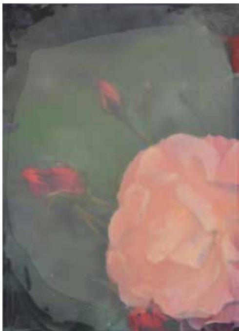
Sockerblommor I. 2014, olja på duk, lack, 50x36 cm