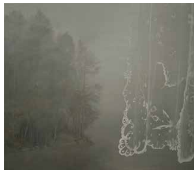
Sommardis III. 2016, olja på duk och serigrafi, 36x40 cm