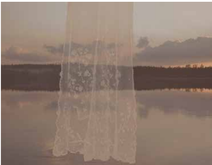
Sommarbröllop. 2016, pigmenttryck, akvatint, fotoetsning, 39x50 cm