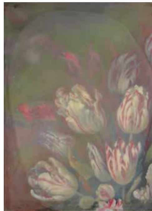
Sockerblommor II. 2014, olja på duk, lack, 50x36 cm