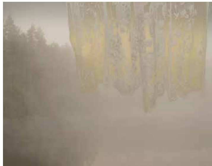
Sommarregn. 2016, pigmenttryck, akvatint, fotoetsning, 39x50 cm