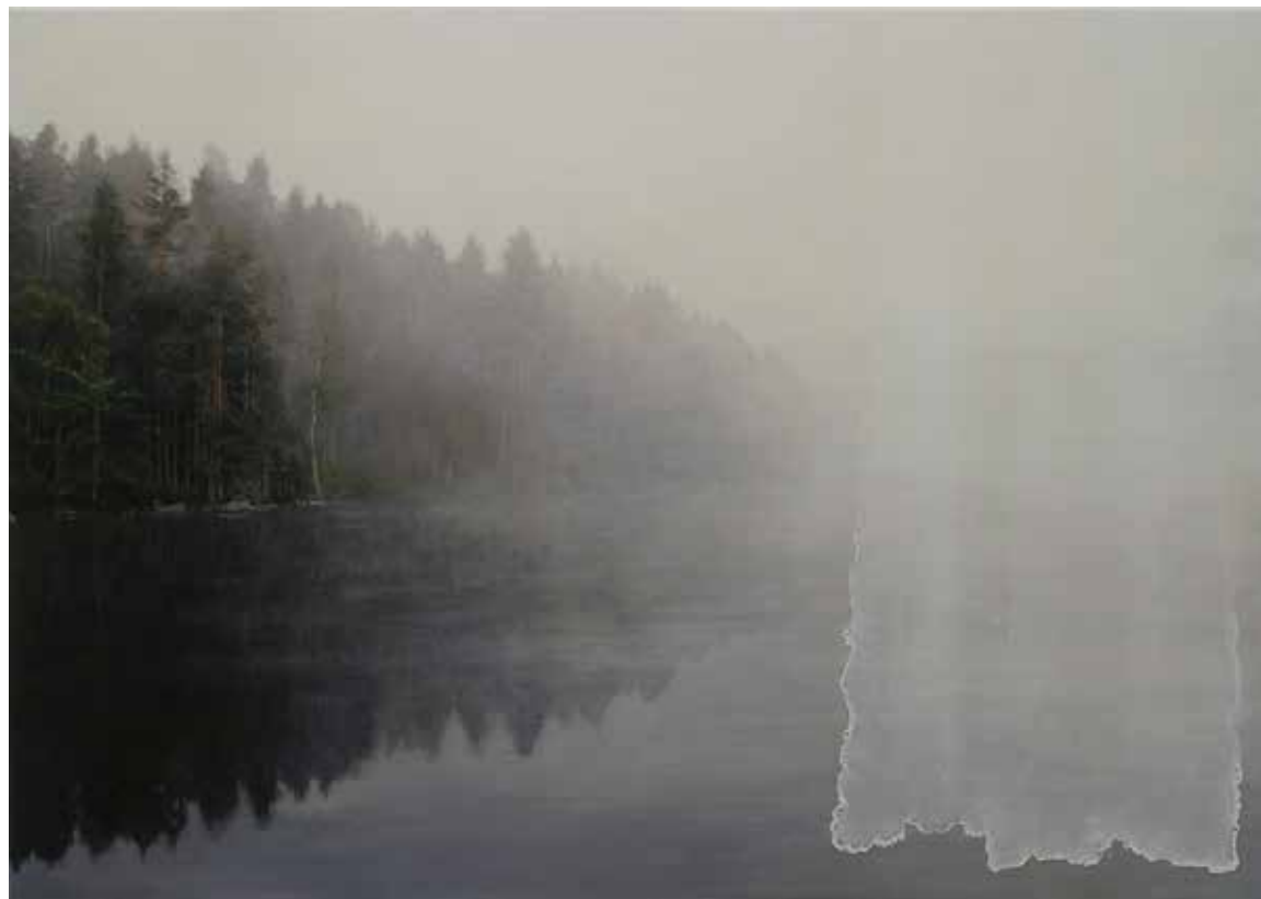
Julidimman. 2016, olja och lack på duk, serigrafi, 70x100 cm