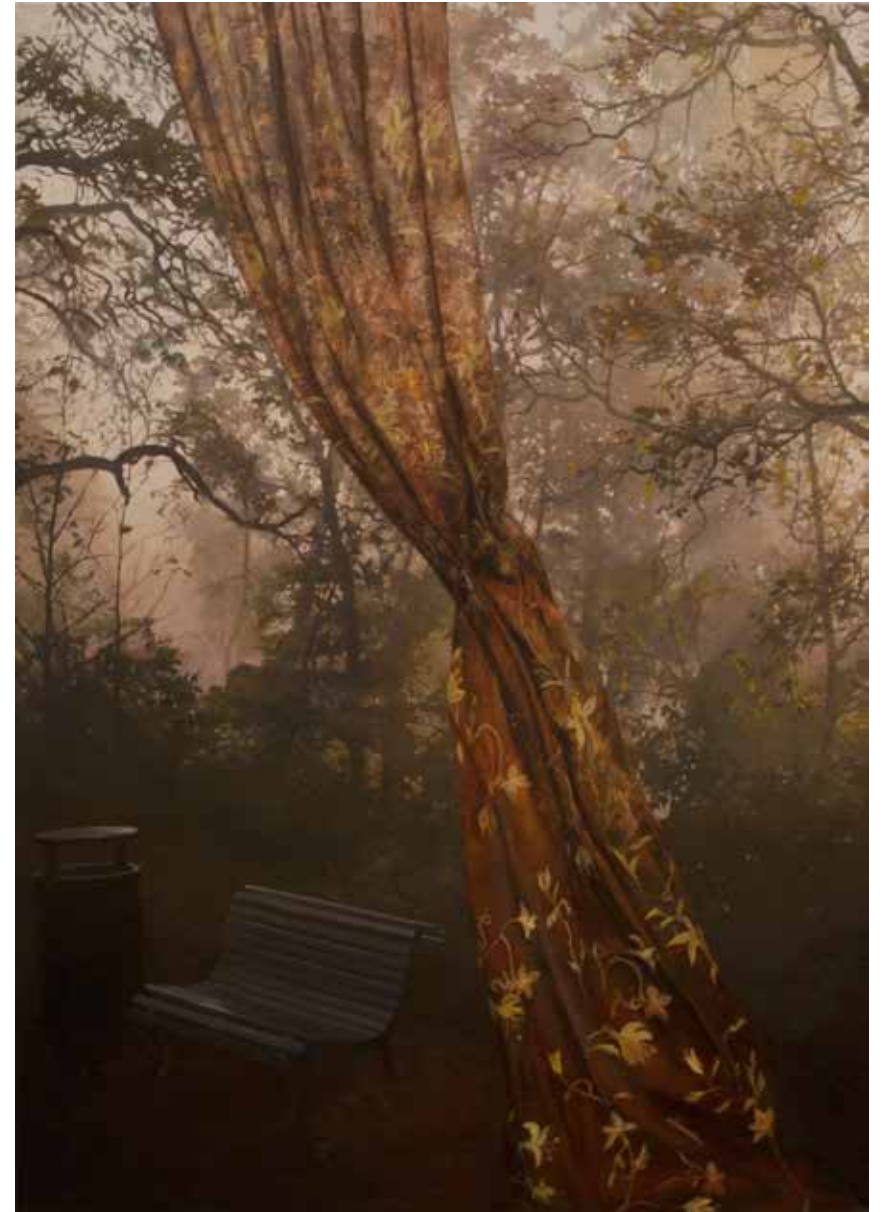
Morgondis I. 2016, olja på pannå, 170x120 cm