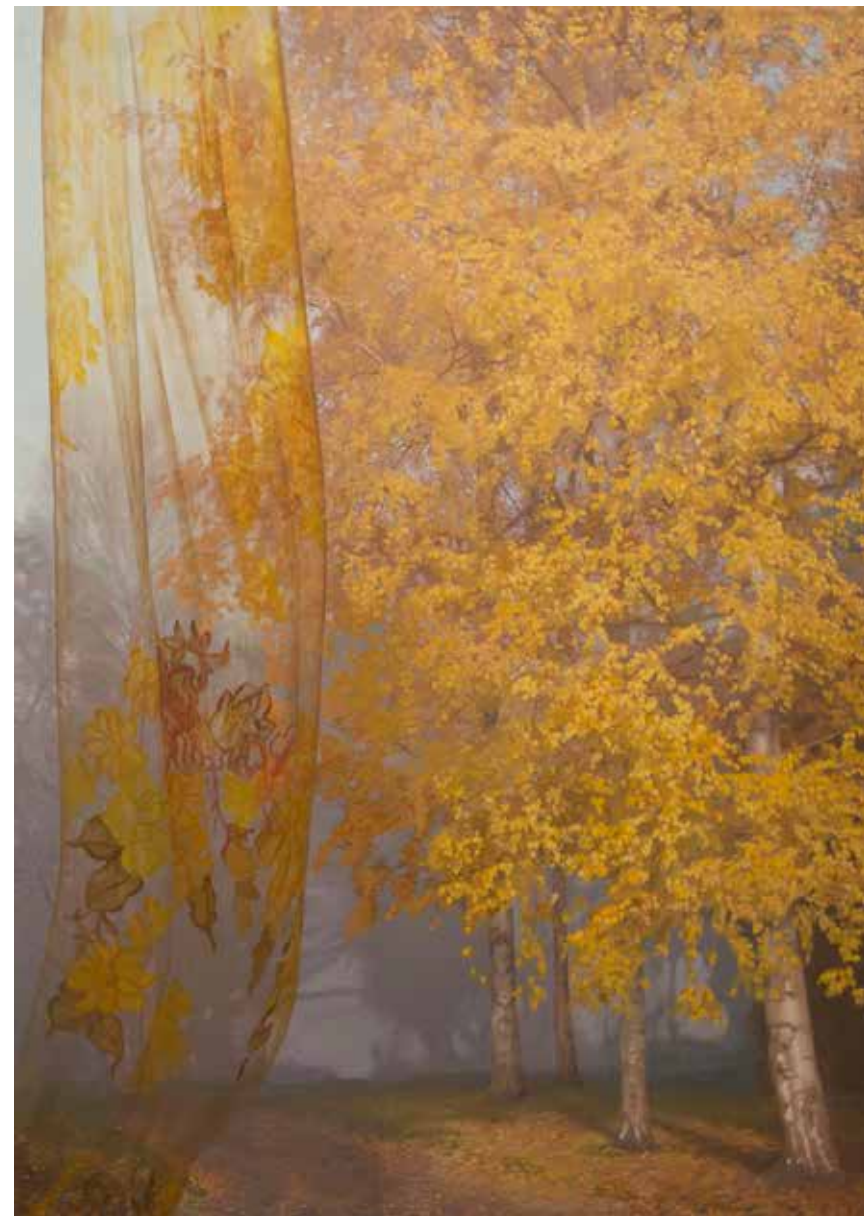
Morgondis III. 2016, olja på duk, 170x100 cm