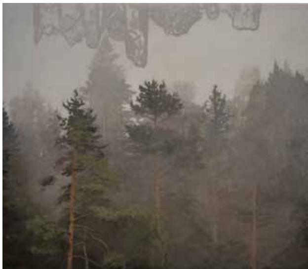
Sommardis II. 2016, olja på duk och serigrafi, 36x40 cm