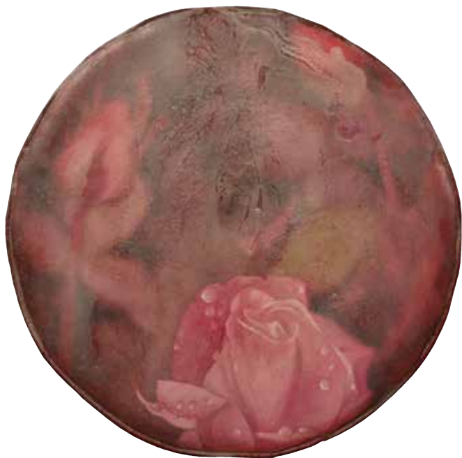
Sockerkudde. 2014, olja på duk, lack, stoppning, ø50 cm