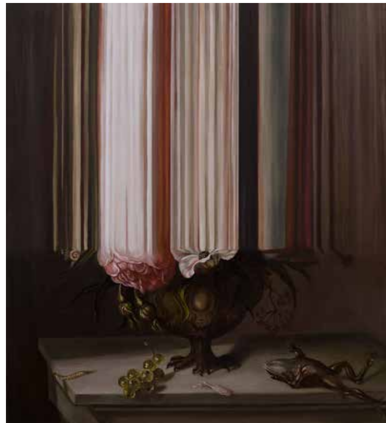
Still-målning II. 2016, olja på duk, 120x110 cm