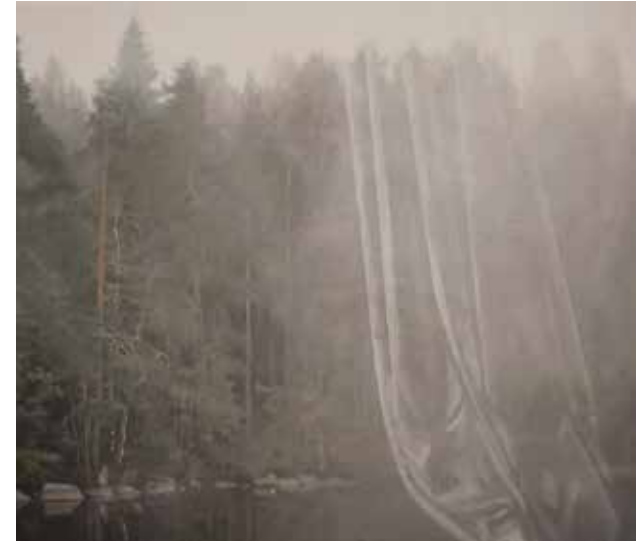
Sommardis I. 2016, olja på duk, 36x40 cm