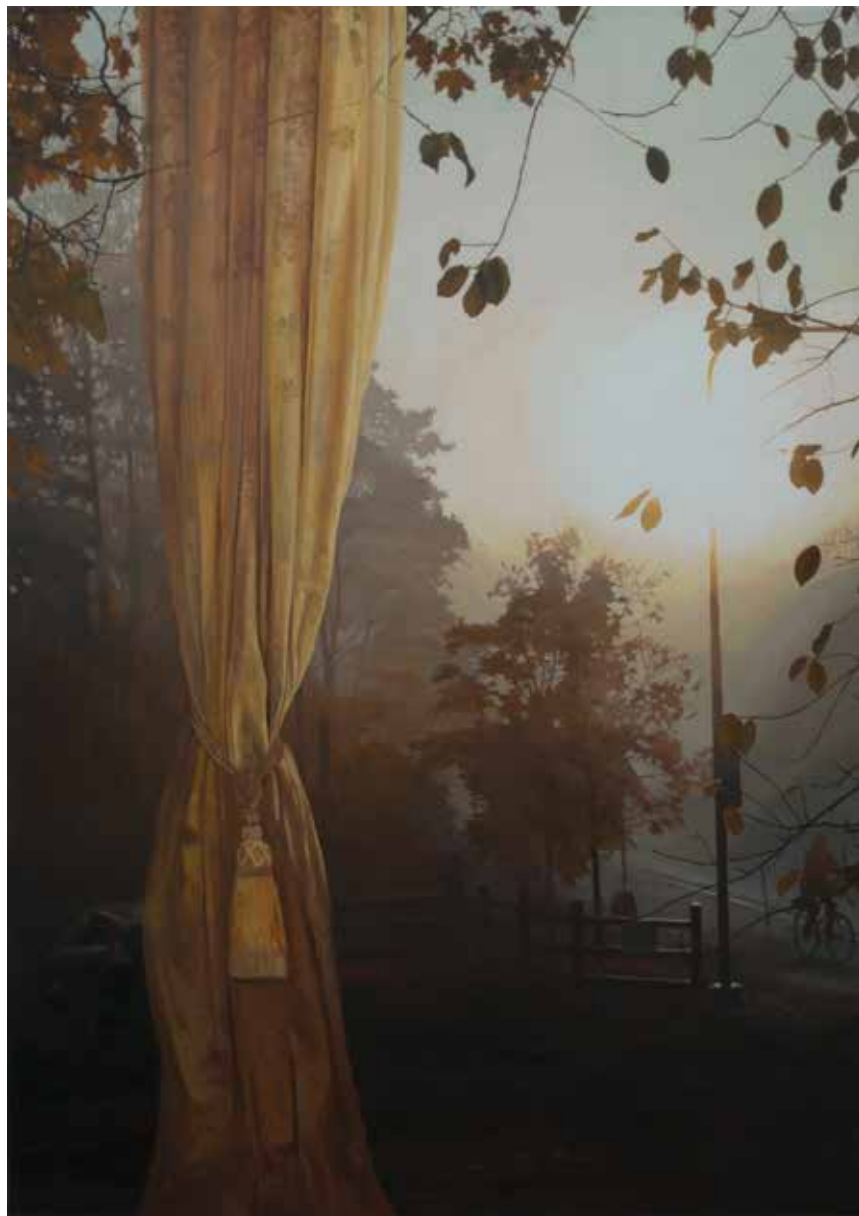
Morgondis II. 2016, olja på duk, 170x120 cm