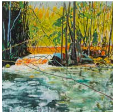
DÄMMET. Olja på duk, 120x120 cm, 2019

Björn Wessmans stora utställning på Prins Eugens Waldemarsudde i Stockholm är avslutad och delar av den uppskattade utställningen flyttar nu till oss i Hishult. Utställningen på Konsthallen får också ett tillskott på 10 nya målningar. På plan 2 kommer det att visas en retrospektiv återblick av Wessmans grafik. Allt lika storslaget som vanligt!